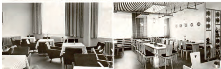
„Thälmann-Haus“, Ansichtskarte 1976

Die Bewirtschaftung hatte zunächst die HO-Wismut, ab 1961 der HO-Kreisbetrieb Auerbach übernommen. In diesen Jahren gab es im Ort ein reiches Kulturleben, von Konzerten über Tanzveranstaltungen und Sportschauen bis zu Theateraufführungen. Der Saal bot sich für Ausstellungszwecke an: Leistungsschauen der Kleintierzüchter und der Briefmarkensammler, Kunstausstellung, Kreis-Messe der Meister von morgen. Nach dreijährigem Umbau wird das Haus 1972 im neuen Gewand wiedereröffnet und es findet die Schulspeisung hier statt, bis 1975 der Speiseraumanbau im Kindergarten übergeben wird.