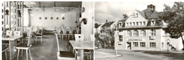
ELLEFELD · KR. AUERBACH / VOGTL. HO - GASTSTÄTTE „THÄLMANNHAUS“

Juli und am 21. Dezember 1947. Über den Jahreswechsel 1947/48 war das Haus Gastgeber der 1. Vogtlandschau der Geflügel- und Kleintierzüchtervereine. Das bis dahin „Thälmann-Speisehaus“ genannte Objekt übernimmt zum 1. Januar 1953 die Gemeinde in Rechtsträgerschaft und wird in „Thälmann-Haus“ umbenannt.