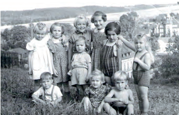
Kinder der Bachstraße ca. 1954 auf der Werkswiese

ne Mutter-Vater-Kind gespielt. Die vielen Trauungen, die sonnabends in der nahegelegenen Lutherkirche stattfanden, regten an, Hochzeit zu spielen. Dazu wurde auf dem Dachboden nach passender Kleidung für die Braut gestöbert, z.B. Omas Unterrock oder ein langes Kleid und eine Gardine als Brautschleier.