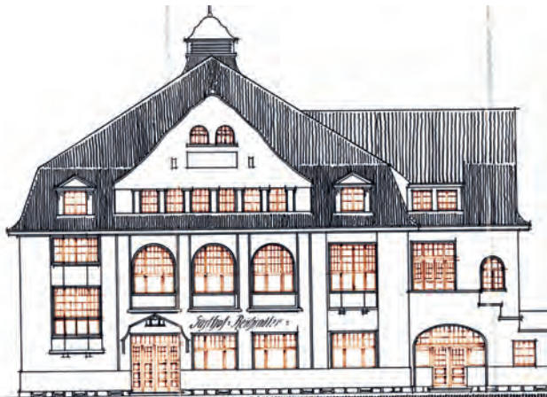
Bauzeichnung für den Wiederaufbau des „Reichsadler“ von 1911