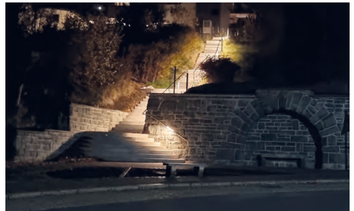
Blick auf die Treppe mit Beleuchtung .

Ausgeführt wurden die Arbeiten von Roscher & Partner Garten- und Landschaftsgestaltung GmbH, geplant und betreut vom Architektur Büro Steudel und von Mitarbeitern der Gemeindeverwaltung Ellefeld. Vielen Dank allen Beteiligten. Gesamtkosten: 200.000 €