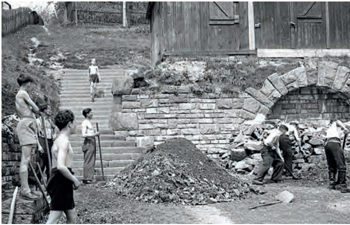
Einsatz im Rahmen des Nationalen Aufbauwerkes (NAW) Ende der 1950er Jahre zum Anlegen eines Blumenbeetes vor dem Treppenaufgang. Oben stehen Schuppen, die beim Bau der Auferstehungskirche benutzt wurden.

ne Mutter-Vater-Kind gespielt. Die vielen Trauungen, die sonnabends in der nahegelegenen Lutherkirche stattfanden, regten an, Hochzeit zu spielen. Dazu wurde auf dem Dachboden nach passender Kleidung für die Braut gestöbert, z.B. Omas Unterrock oder ein langes Kleid und eine Gardine als Brautschleier.