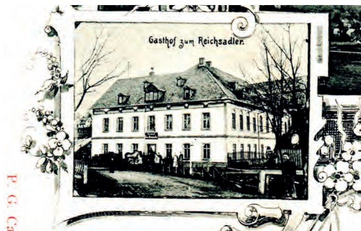
Gasthof zum Reichsadler, Teil einer Ansichtskarte, um 1890

Am 15. August 1911 unterbreitet der „Actien-Brauverein Plauen i.V.“ dem Gemeindeamt Ellefeld ein „Gesuch zum Wiederaufbau des abgebrannten Gasthofs >Reichsadler<“ nebst 18 Bau-Zeichnungen. Der Plauener Architekt Fritz Kohl stellte einen Entwurf vor, der dem Gebäude ein gänzlich anderes Aussehen als das vorherige geben sollte. Eine reich gegliederte Fassade soll dem Gasthof von der Straße her ein dem Namen angemessenes Äußeres bieten: Große Fenster in der Gaststube und im Saal, der sich im Obergeschoss befindet, wie auch im Treppenaufgang. Eine aufwändige Dachkonstruktion krönt das Gebäude. Nach rechts ist der Anbau einer Kegelbahn vorgesehen Für die damalige Zeit war das ein außerordentlich moderner und in die Zukunft weisender Plan, wie es sich in den folgenden Jahrzehnten erweisen sollte.