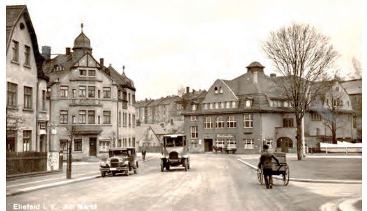
Marktplatz mit „Reichsadler“, Ansichtskarte dreißiger Jahre

Nach entsprechenden Genehmigungsverfahren seitens der Amtshauptmannschaft Auerbach, des Königl. Sächsischen Straßen- und Wasserbauamtes, des Königl. Sächsischen Finanzministeriums und der Baupolizei, der ausführlichen Prüfung der Konstruktionsunterlagen sowie der Einigung mit den nachbarlichen Grundstückseigentümern begannen im Mai 1912 die Bauarbeiten. Im September 1912 ist der Rohbau fertig. Von der Anlage eines Pferdestalls (mit Wagen) für den Transport von Gästen zur Bahn etc. wurde abgesehen, da dies bei nur vier Fremdenzimmern als unrentabel galt.