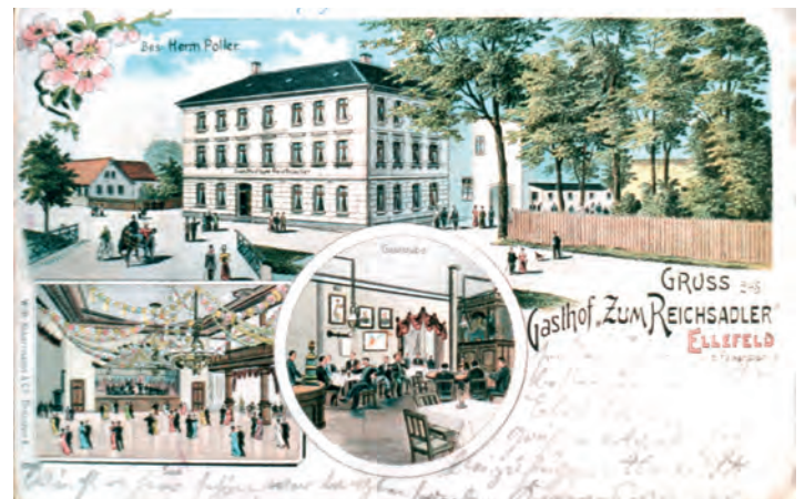
„Reichsadler“, Ansichtskarte um 1900

Daß in Folge dessen diese Vereine ihre Versammlungen z.Zt. in der Turnhalle abhalten müssen, ist ein Übelstand, dessen baldige Beseitigung sicherlich höchst wünschenswert ist. ...“.