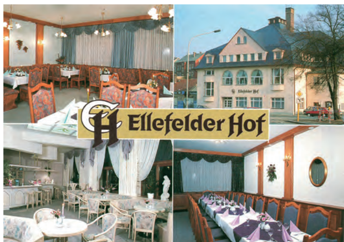
„Ellefelder Hof“, Ansichtskarte 1992 (Ansichtskarten Slg. Teichmann, Zeichnung Gemeinde-Archiv)

Die Bewirtschaftung hatte zunächst die HO-Wismut, ab 1961 der HO-Kreisbetrieb Auerbach übernommen. In diesen Jahren gab es im Ort ein reiches Kulturleben, von Konzerten über Tanzveranstaltungen und Sportschauen bis zu Theateraufführungen. Der Saal bot sich für Ausstellungszwecke an: Leistungsschauen der Kleintierzüchter und der Briefmarkensammler, Kunstausstellung, Kreis-Messe der Meister von morgen. Nach dreijährigem Umbau wird das Haus 1972 im neuen Gewand wiedereröffnet und es findet die Schulspeisung hier statt, bis 1975 der Speiseraumanbau im Kindergarten übergeben wird.