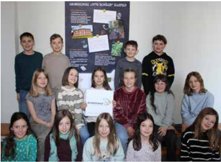
Unsere Energiedetektive der 4. Klasse

Am 29. Januar 2026 fand im Dresdner Landtag die diesjährige Klimaschulkonferenz statt. Während der feierlichen Auszeichnung wurde unserer Grundschule der Titel Klimaschule verliehen. Insgesamt wurden 17 neue sächsische Schulen ausgezeichnet. Den Titel „Klimaschule“ dürfen wir nun für fünf Jahre tragen. Damit verbunden sind nicht nur Anerkennung und Motivation für unser Engagement, sondern auch zusätzliche finanzielle Mittel zur Weiterentwicklung nachhaltiger Projekte. Ein erstes Vorhaben soll ein umfassendes Mülltrennsystem für alle Klassen sein. Ziel ist es, unseren Müll konsequent zu trennen, Recycling zu fördern und das Umweltbewusstsein der Schülerinnen und Schüler weiter zu stärken. Der nachhaltige Umgang mit Ressourcen hat an unserer Schule schon seit vielen Jahren einen hohen Stellenwert. Zahlreiche Projekte, Aktionen und Unterrichtsinhalte widmen sich dem Klima- und Umweltschutz. Die Auszeichnung als Klimaschule bestätigt diesen Weg und spornt zugleich an, das Engagement in Zukunft weiter auszubauen.