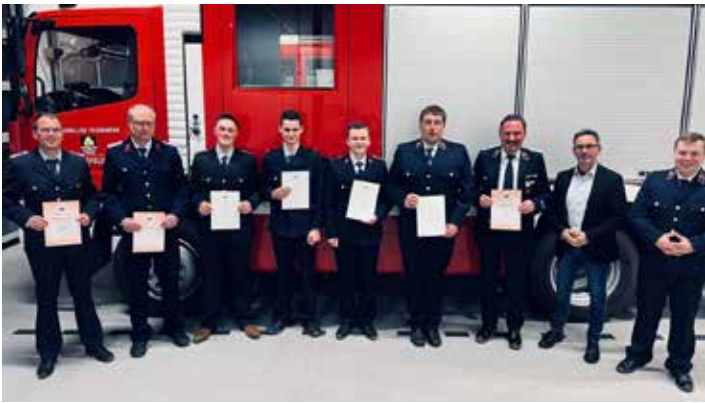
Herzlichen Glückwunsch!

Im Rahmen der diesjährigen Jahreshauptversammlung der Freiwilligen Feuerwehr wurde erneut deutlich, welch unverzichtbaren Beitrag unsere Feuerwehrkameradinnen und -kameraden für die Sicherheit und das Zusammenleben in unserer Gemeinde leisten.